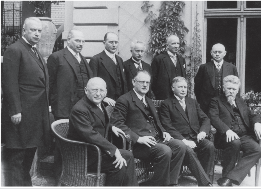
Das Kabinett der Großen Koalition, Juni 1928. Sitzend von links: Erich Koch-Weser (Justiz), Hermann Müller (Kanzler), Wilhelm Groener (Reichswehr), Rudolf Wissell (Arbeit). Stehend von links: Hermann Dietrich (Ernährung), Rudolf Hilferding (Finanzen), Julius Curtius (Wirtschaft), Carl Severing (Inneres), Theodor von Guérard (Verkehr und besetzte Gebiete), Georg Schätzel (Post). Es fehlt Außenminister Gustav Stresemann, der zur Kur bei Baden-Baden weilte.