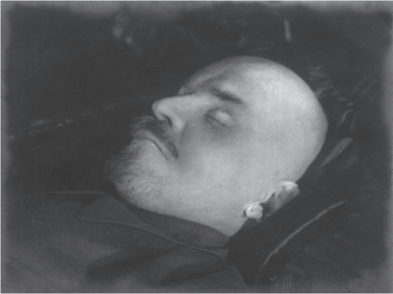
«Sein Ausdruck war so unsagbar friedlich»: Der aufgebaarte Leichnam Rathenaus in seiner Villa in Berlin-Grunewald.

hinüberlehnen und nahm an, dass er durch die Explosion verletzt sei», sagt sie zwei Tage später aus. «Ich eilte herüber um ihm als Schwester Hilfe zu leisten. Als ich näherkam, sah ich, dass der Herr stark blutete am Gesicht und auch an den unteren Gliedmaßen und in dem Auto eine große Blutlache stand. Außerdem brannte der Mattenbelag des Autos. Ich trat das Feuer aus und stieg hinein, stellte mich dem fahrenden Chauffeur als Schwester vor und sagte ihm, dass ich ihm behilflich sein wollte.» 2