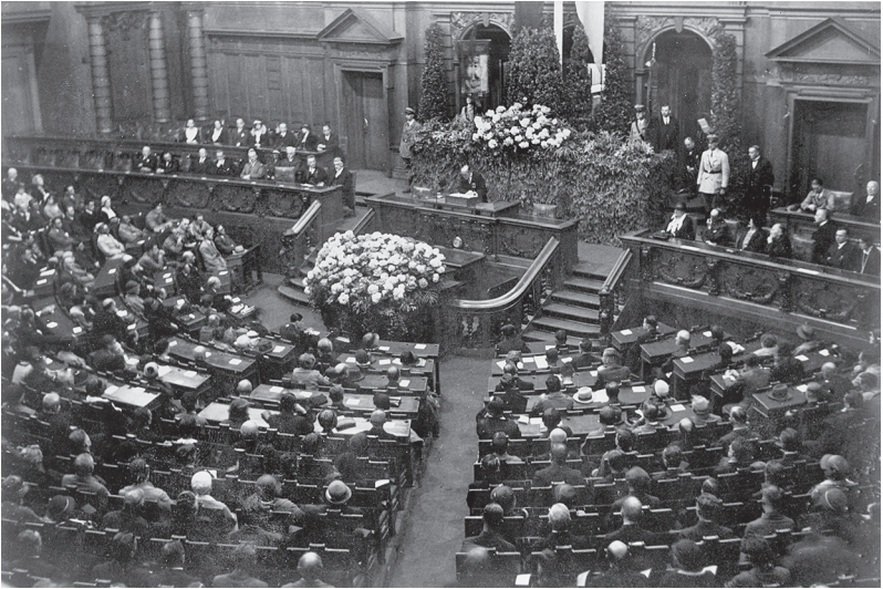
25. Juni 1922: Im Reichstag hält Reichskanzler Joseph Wirth eine große Trauerrede auf Rathenau

gen bis zum späten Abend unter der schwarz-rot-goldenen Fahne schweigend durch die Straßen Berlins. Die gespaltene Linke rückte, wie es schien, wieder zusammen. Eine Sympathiewelle für die Republik ging durchs Land. «Die Erbitterung gegen die Mörder Rathenaus ist tief und echt, ebenso der feste Wille zur Republik, der viel tiefer sitzt als der vorkriegsmonarchische «Patriotismus», stellte Harry Graf Kessler fest. 27