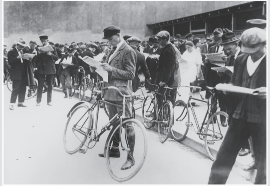
Die Weltwirtschaftskrise trifft Deutschland seit 1929/30 mit voller Wucht: Arbeitslose studieren die wenigen Jobangebote in den Zeitungen.