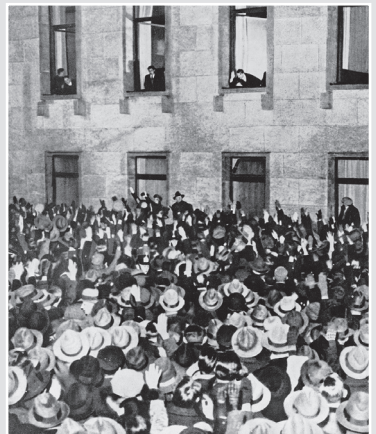
30. Januar 1933: Am Abend lässt sich Hitler am Fenster der Reichskanzlei in der Wilhelmstraße von der Menge feiern.