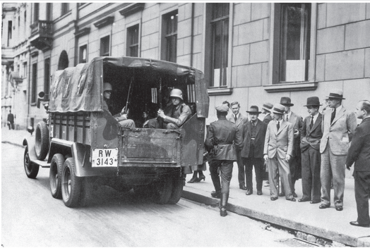
Der «Preußenschlag» vom 20. Juli 1932: Truppen der Reichswehr postieren sich vor dem preußischen Staatsministerium in der Wilhelmstraße.